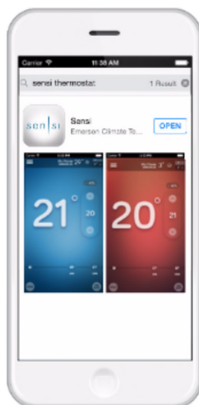
Image de l'App Store d'Apple

Lors du téléchargement de l'application Sensi, on vous demandera de créer un compte. Cette étape est nécessaire pour vous connecter au thermostat par l'entremise du réseau sans fil (Wi-Fi). Utiliser une adresse courriel valide et un mot de passe de votre choix pour créer un compte. Se souvenir de l'adresse courriel et du mot de passe. Une fois enregistré, le thermostat Sensi est lié à cette adresse courriel.