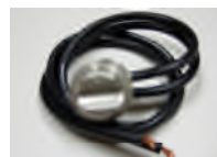
Moteur de remplacement