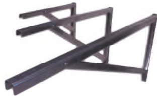
Support mural ou à terre