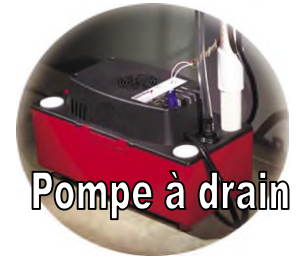
Pompe à drain